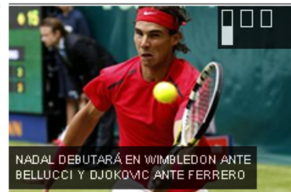
NADAL DEBUTARÁ EN WIMBLEDON ANTE BELLUCCI Y DJOKOVIC ANTE FERRERO